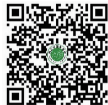
义务植树捐资二维码

公民可通过扫描以下二维码进行捐资植树,并获取市慈善总会电子捐赠证书。根据《全民义务植树尽责形式管理办法(试行)》规定,捐资60元及以上,折算完成3株及以上植树任务。