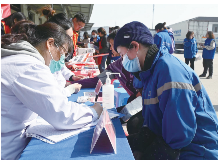
关爱新业态新就业女性

来自律师事务所的“法律服务员”解答有关妇女权益保护的法律问题。志愿者还为“两新”女职工送上了“法治礼包”,包括《反家庭暴力法》《民法典》等内容的宣传手册。