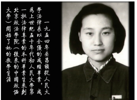
1954年,巫昌祯在中国人民大学法律系任教。她积极投身反家暴立法,为推动反家暴立法做出了巨大的贡献。2015年12月4日,第二个国家宪法日,第十五个法制宣传日,中国政法大学教授巫昌祯,因在反家暴立法领域做出巨大贡献,当选为年度法治人物。

姻法等领域的学术研究,目睹了家庭暴力的危害,她积极奔走,努力呼吁,让更多的人转变观念,向家庭暴力说不,为推动反家暴立法做出了巨大的贡献。2014年“国际消除家庭暴力日”当天,国务院法制办公布了《中华人民共和国反家庭暴力法(草案)》,同时向全社会公开征求意见。2015年8月24日,这部草案被提交全国人大审议。自1995年“家庭暴力”的概念引入中国后,反家暴立法已走过20年。与其他多年致力于此的学者和民间人士一样,耄耋之年的巫昌祯对这部等待了多年的法律充满期待。因为,家和和睦是她一生的心愿。为此,她一边奔走呼吁,推动观念的更新与立法的进程,一边教书育人,培养大批优秀的法律人才。