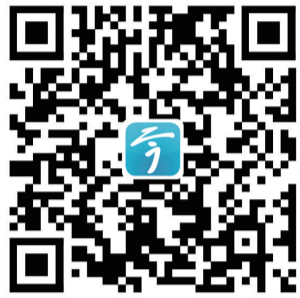
扫二维码 看更多优秀女性微传记

编者按:近日,在镇江报业传媒集团和市民阅读办、市史志办、市妇联联合主办的“我为镇江女性写微传记”活动中,热心好友王国亚先生创作了著名法学家、新中国婚姻法学科奠基人巫昌祯教授的微传记,引发大家对镇江这位优秀女性的关注。在巫昌祯教授逝世3周年之际,本报特刊发此文,以表达对这位杰出乡贤的景仰和追思。