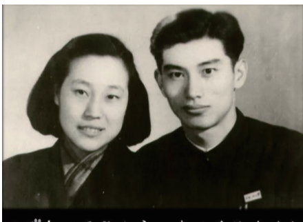
1954年巫昌祯和庚以泰结婚合影。巫昌祯和庚以泰一家的影集里,珍藏着一张几十年前的照片。那是1954年,两个风华正茂的年轻人的结婚照。

两人共同经历了近半个世纪的风风雨雨,2003年夏天,他们再次拍下一张合影,庚教授满头华发,巫教授轻轻地依偎在他的身旁。两个人49年的婚姻,超越半个世纪的爱情之路,就这样向前延伸。在CCTV2015年度法治人物颁奖礼官网上这样介绍巫昌祯教授:巫昌祯——耄耋之年,积极推动反家暴立法。她既是法学教育家,也是法律援助律师。她既是妇女权益的保护者,更是一位立法反家庭暴力的推动者。巫昌祯,中国政法大学教授,一生与法同行。