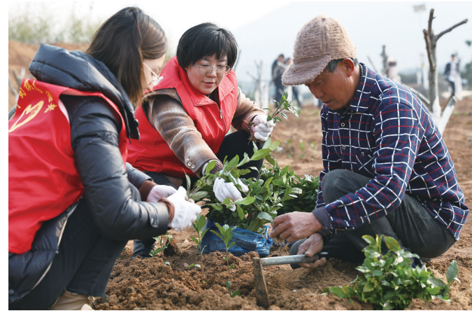
3月1日，句容市下蜀镇的志愿者走进茶园，和茶农一起栽苗。 辛一 夏建玲 摄影报道

3月1日，由高新区蒋乔街道九华山庄村新时代文明实践站、江苏大学附属医院联合主办的“九华山庄学雷锋志愿服务集市”在九华山庄文体活动中心广场暖心开市。30多名志愿者为村民提供各类志愿服务。 文雯 丁晓明 摄影报道