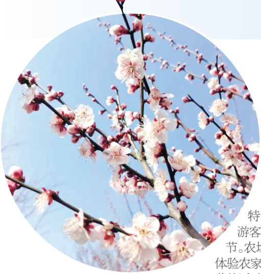
本报记者 周迎 本报通讯员 尤恒

“这个草莓好好吃啊，快来多采一点。”这家的老母鸡汤特别正宗，香呢。暖阳和煦，春意已浓，镇江的乡村大地，在春日里透着美好。久居城市的市民们纷纷趁着周末的美好时光，追逐春的脚步，欣赏美丽乡村，探寻乡村味道，用“周末经济”带动城市和乡村的双向奔赴。