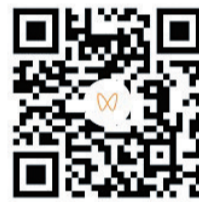
参赛作品选登之三 视频拍摄: 秦立华 视频制作: 盛林娟