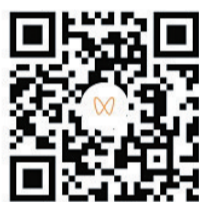
参赛作品选登之二 视频拍摄: 盛林娟 视频制作: 辛一