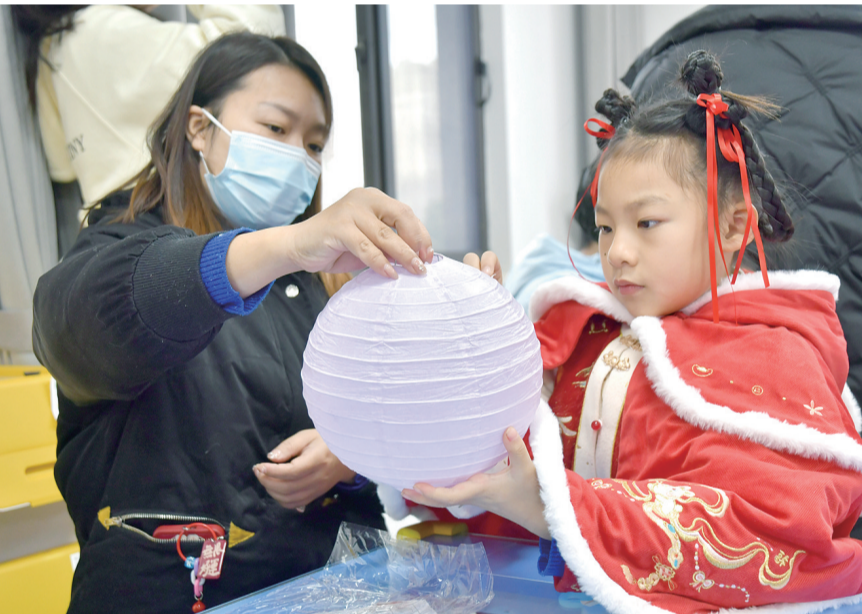
传承民俗情 欢乐迎元宵

2月2日,京口区健康路街道健康社区联合中信银行镇江京润支行开展“喜乐元宵”活动,居民们做花灯、猜灯谜、品汤圆,喜迎元宵佳节。