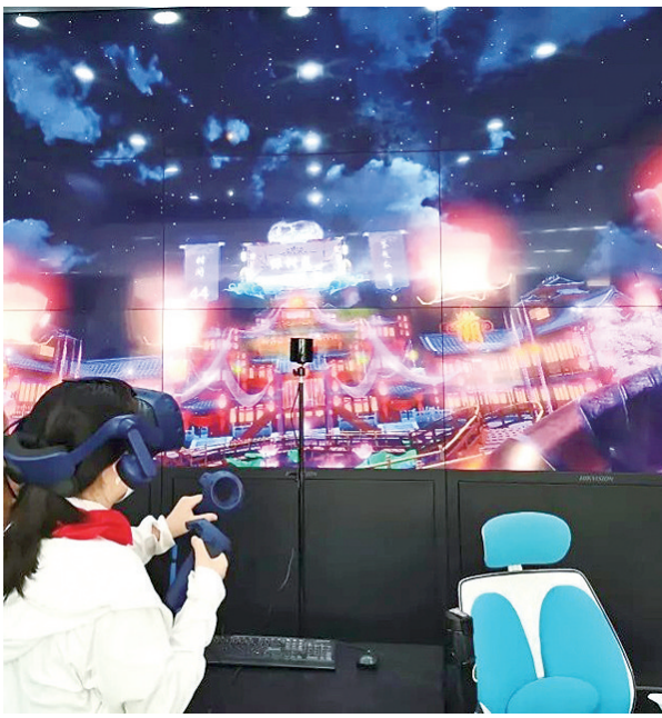
市图书馆VR成语论箭

市图书馆还特别策划了“舌尖上的年味——中国春节传统美食主题展”,分为“年夜饭简史”“中国各地春节传统美