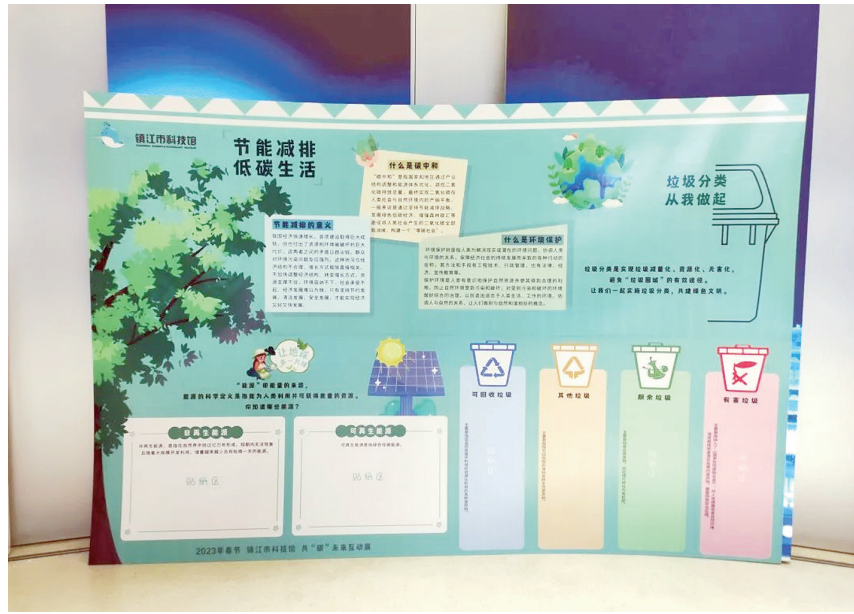
市科技馆的低碳生活宣传

镇江是第二批国家低碳试点城市,市科技馆在春节假期里,将推出丰富的自然资源科普实验活动,邀请广大市民一起共“碳”未来。