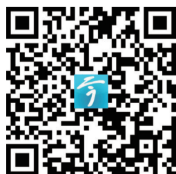
扫码看相关视频 视频制作 张宇杰

车水马龙的街道，摩肩接踵的超市、熙熙攘攘的商场……处处是忙碌的身影、热闹的场景，升腾着满满的“烟火气”。春节的脚步越来越近，热气腾腾的镇江，回归啦！