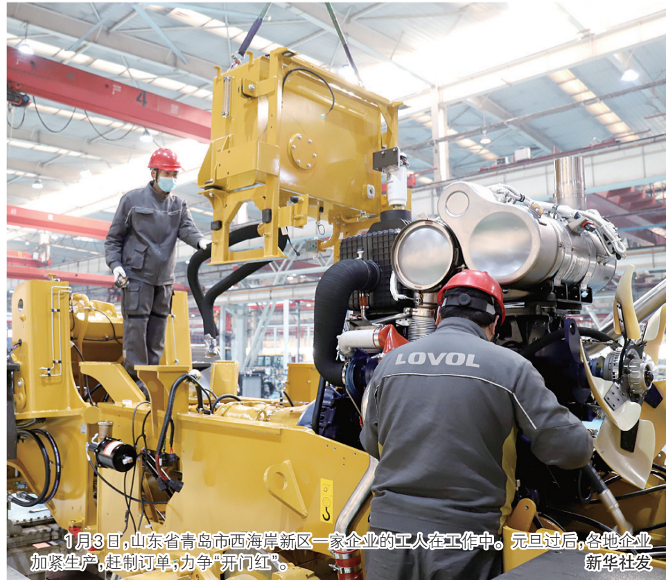
1月3日，山东省青岛市西海岸新区一家企业的工人在工作中。元旦过后，各地企业加紧生产，赶制订单，力争“开门红”。 新华社发