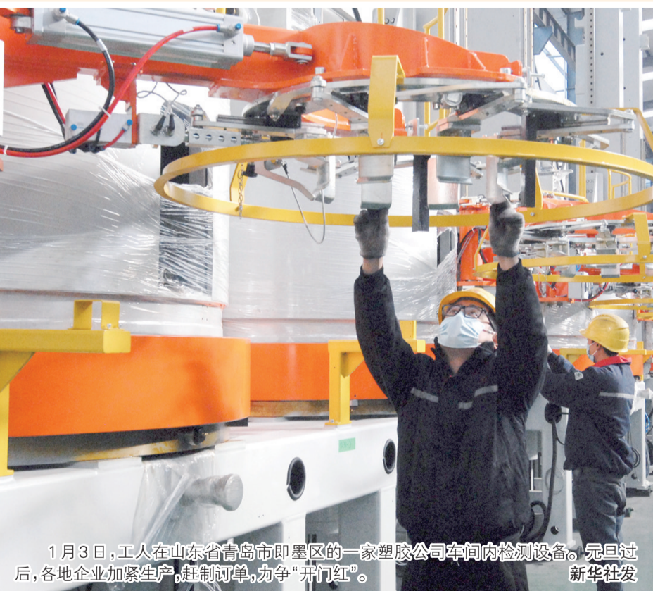
1月3日，工人在山东省青岛市即墨区的一家塑胶公司车间内检测设备。元旦过后，各地企业加紧生产，赶制订单，力争“开门红”。