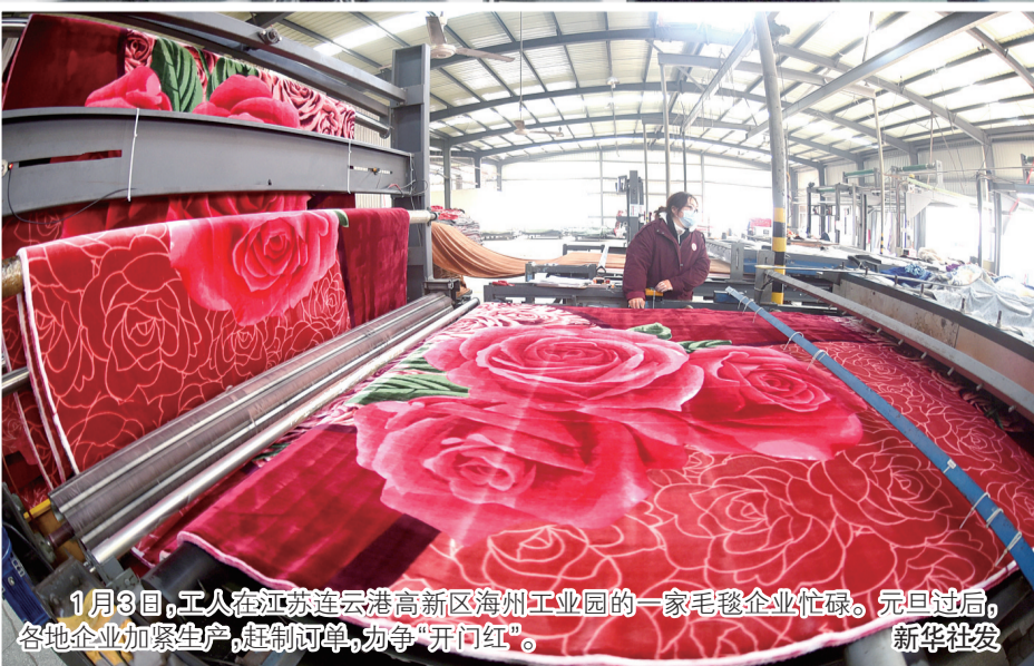
1月3日，工人在江苏连云港高新区海州工业园的一家毛毯企业忙碌。元旦过后，各地企业加紧生产，赶制订单，力争“开门红”。