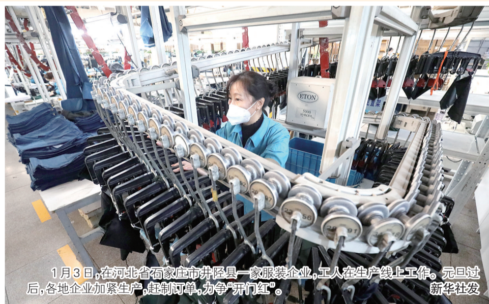
1月3日，在河北省石家庄市井陘县一家服装企业，工人在生产线上工作。元旦过后，各地企业加紧生产，赶制订单，力争“开门红”。