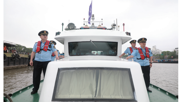
百日攻坚专项行动之水上执法检查