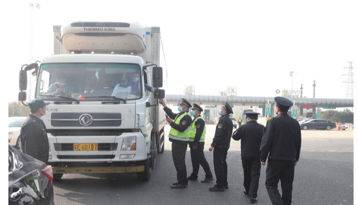
2022年11月25日，两省7市同步联动，长三角区域道路运输联合执法第二次集中整治行动在镇江打响