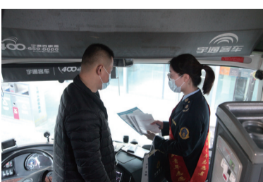
举办信用宣传日活动，向客货车司机普及信用知识