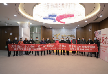
举办“贯彻党的二十大精神，暖‘新’向前行——2022货车司机关爱日”活动