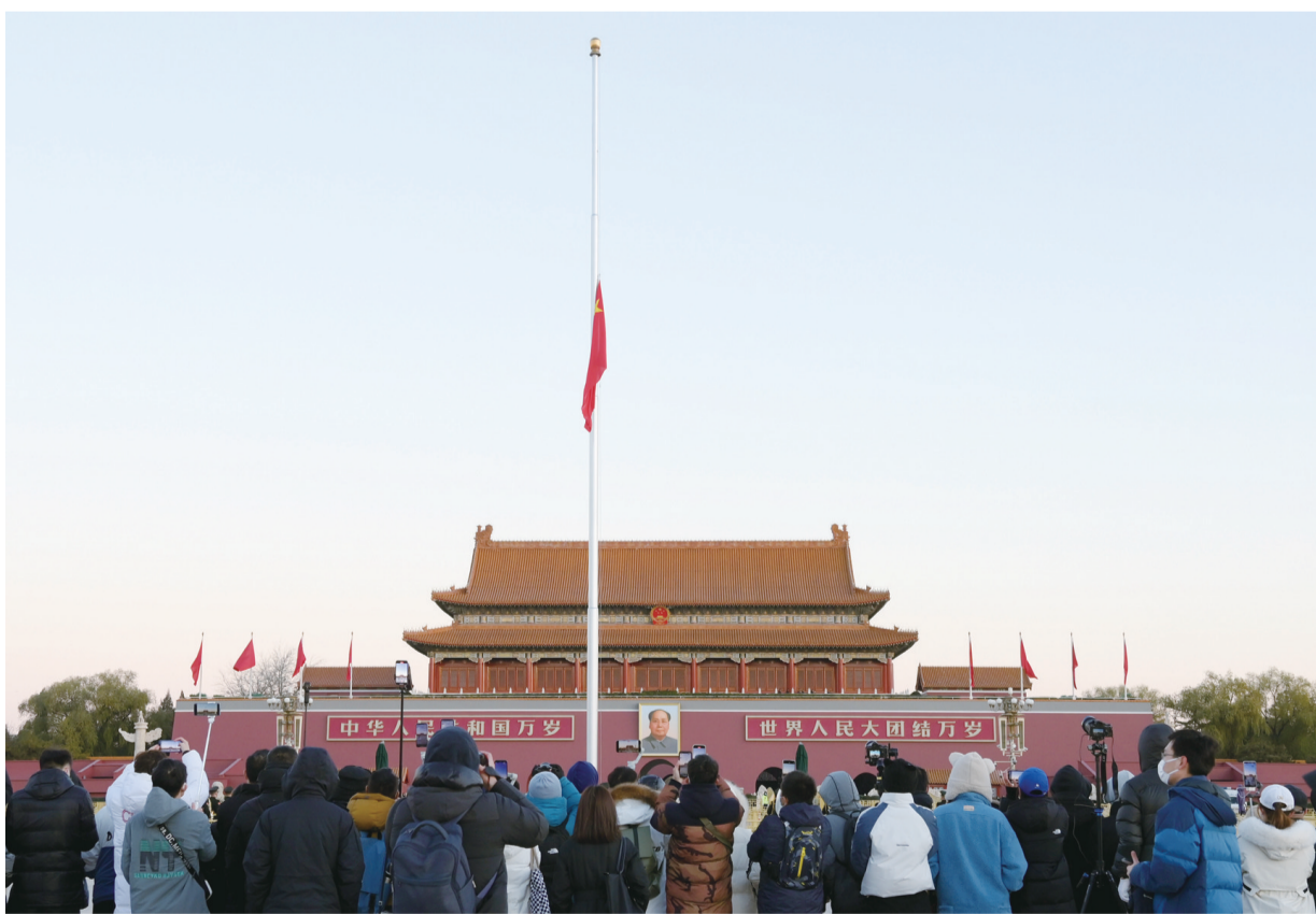
北京天安门下半旗志哀,悼念江泽民同志逝世。

从党的十三届四中全会到党的十六大的十三年中党和国家取得的巨大成就,同江泽民同志作为马克思主义政治家的雄才大略、关键作用、高超政治领导艺术是分不开的。