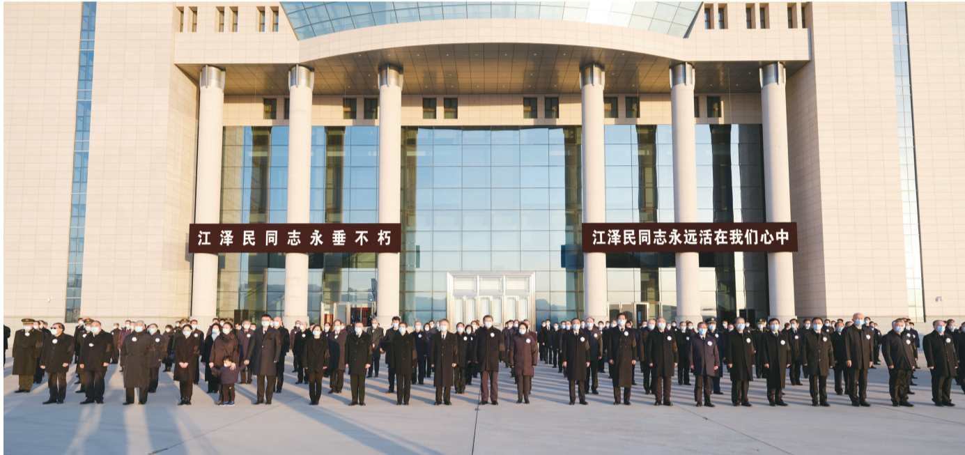
习近平、李克强、栗战书、汪洋、李强、赵乐际、王沪宁、韩正、丁薛祥、李希、王岐山等党和国家领导同志到北京西郊机场迎灵。蔡奇等从上海护送江泽民同志遗体回到北京。