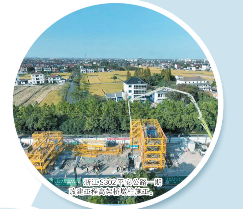
浙江S302平安公路一期改建工程高架桥墩柱施工。