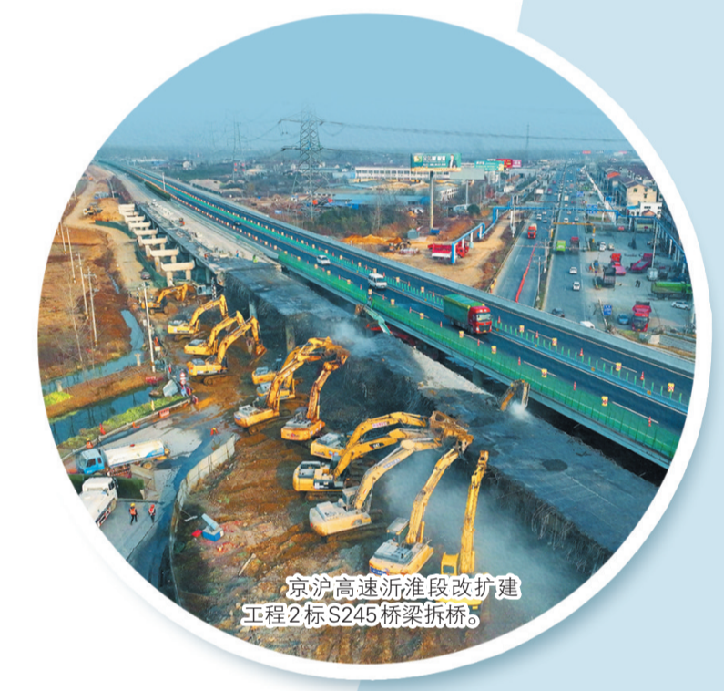
京沪高速沂淮段改扩建工程2标S245桥梁拆桥。