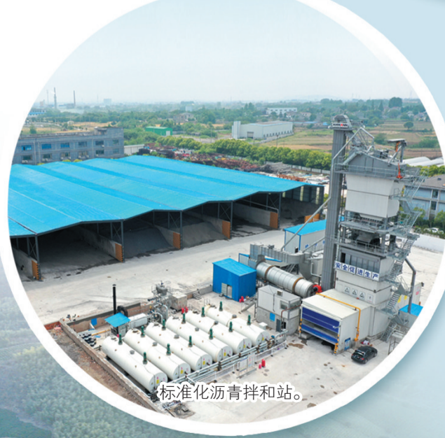
标准化沥青拌和站。