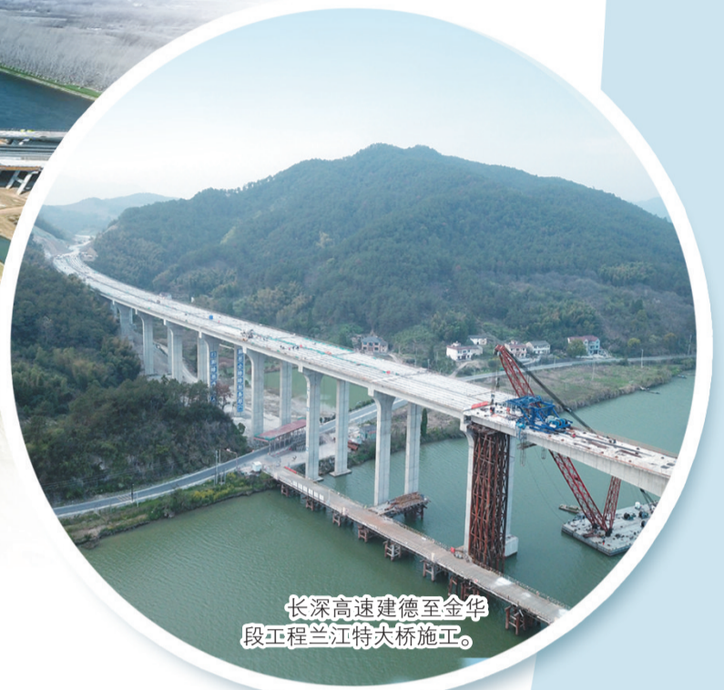
长深高速建德至金华段工程兰江特大桥施工。

得益于“一体两翼”发展战略不断深化和实践,镇江路桥发展持续向好,中标额节节攀升,项目相继获得浙江省、江苏省和全国施工类从业单位AA最高信用等级评价。同时,公司积极抢抓机遇,成功拓展新渠道,进军市政养护领域,聚焦桥梁加固、跨江桥墩柱防撞加固等技术攻关并取得突破,今年成功获得省交通运输厅颁发的公路养护作业单位全部四项资质证书,为打开“公路养护”新篇章打下坚实基础。特别值得一提的是,经过两年半的艰苦谈判,公司于今年胜利完成对镇江泰普克沥青有限公司的全部股权收购,其成熟的沥青生产、仓储、贸易优势,撑起路桥伸展的臂膀,成为未来新路桥的经济增长点。