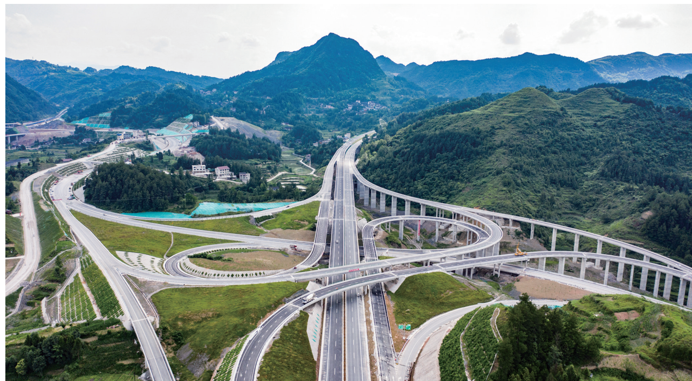
贵州石旸至玉屏高速公路花桥互通（2021年6月17日摄，无人机照片）。