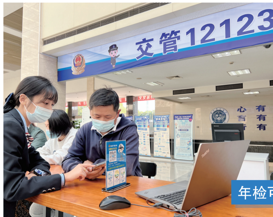
10月18日,市车管所工作人员向市民介绍如何网上预约。根据公安部、市场监管总局、生态环境部、交通运输部联合印发的《关于深化机动车检验制度改革优化车检服务工作的意见》,非营运小型汽车、摩托车可以通过“交管12123”APP进行年检预约,群众可根据实际情况就近选择年检机构,预约成功后随到随检。