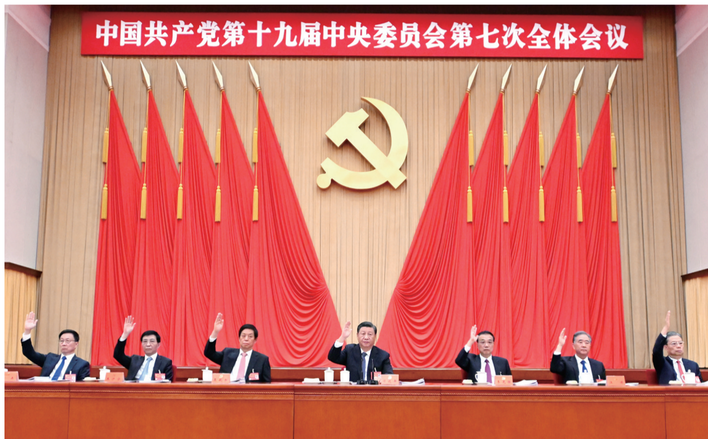
中国共产党第十九届中央委员会第七次全体会议