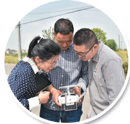
持续推进“规划师下乡”助力乡村振兴