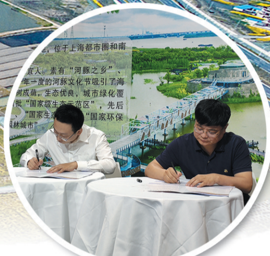
参加中国（南京）城市土地展推介优质地块

强化互联互通。 加快城市综合交通规划修编，开展镇泰城际铁路通道、常泰过江通道衔接、-12.5m深水航道与港区提升、城市轨道交通一体化发展等方面的研究，强化与周边区域的交通互联互通，不断提升综合运输服务能力，促进优质资源共建共享。