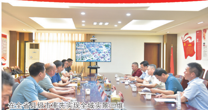
在全省县级市率先实现全域实景三维