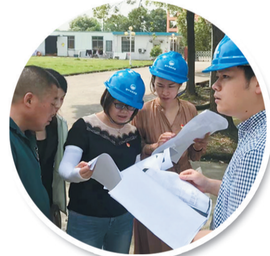
项目党小组工作在一线

节约集约用地。 对扬中可利用资源进行全面调查，进一步梳理存量、低效用地，加大批而未供土地盘活利用。进一步加强宣传引导，鼓励各镇（街、区）优化招商机制，优先利用已批未供土地，提升土地使用质效，激发资源和资产活力，为全市经济发展增势赋能。