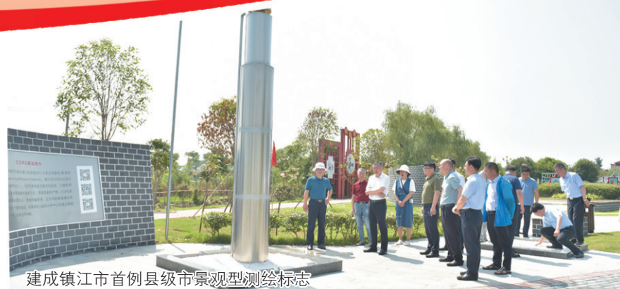
建成镇江市首例县级市景观型测绘标志