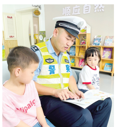
交警进校园 交规润童心

做强“特色活动班”,提升校级干部行动力。校长课堂系列活动,持续开展中小学、幼儿园校级领导评课、赛课活动,努力将新的课堂教学基本要求在校层面率先得以贯彻落实;教育论坛系列活动,围绕教育改革、校本研修、队伍建设、教育管理、特色建设、质量提升等主题组织讲座,每月一次,每次4人;教育之声系统活动,由副校长结合教育形势、自身实践发表教育观念录制视频上报;校长读书系列活动,每年为校级领导推荐必读书目,并要求校长撰写读书心得和管理案例,副校长撰写读书心得和教育故事,不断提升校级干部的理论功底和专业素养。