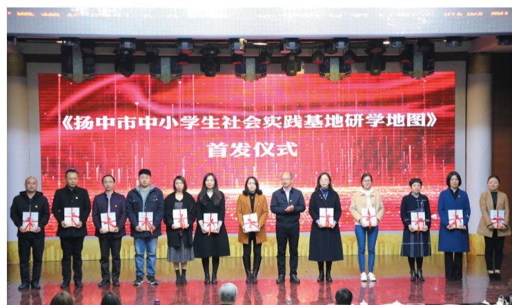
《扬中市中小学生学习基地研学地图》首发仪式