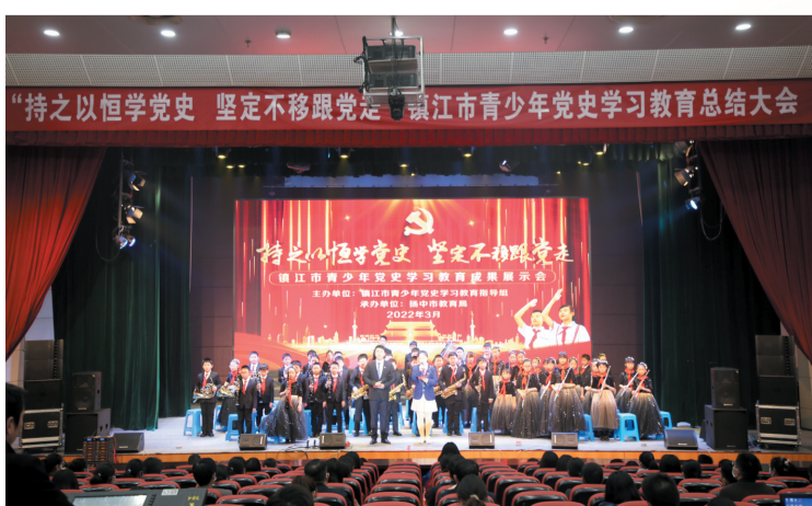
镇江市青少年党史学习教育总结大会