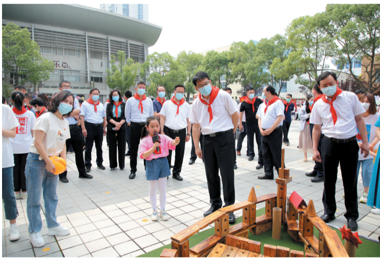
扬中四套班子领导与学生共庆“六一”

以劳励志，将奋斗精神深耕厚植于心。注重课程建设，确立独具特色的课程建设目标，征集中小学劳动教育典型案例；注重基地建设，以校为主统筹配置劳动教育资源；注重队伍建设，配备专兼职劳动教师，提升教研能力。