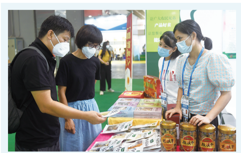
8月26日,客商在广州博览会乡村振兴展上参观选购农副产品。