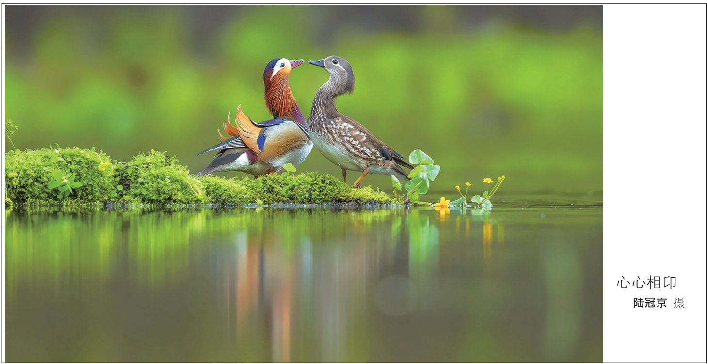
心心相印

我离开深山时已到黄昏，晚霞灿烂，那个光影闪烁中的林中小院，恍若我看到的童话小屋。