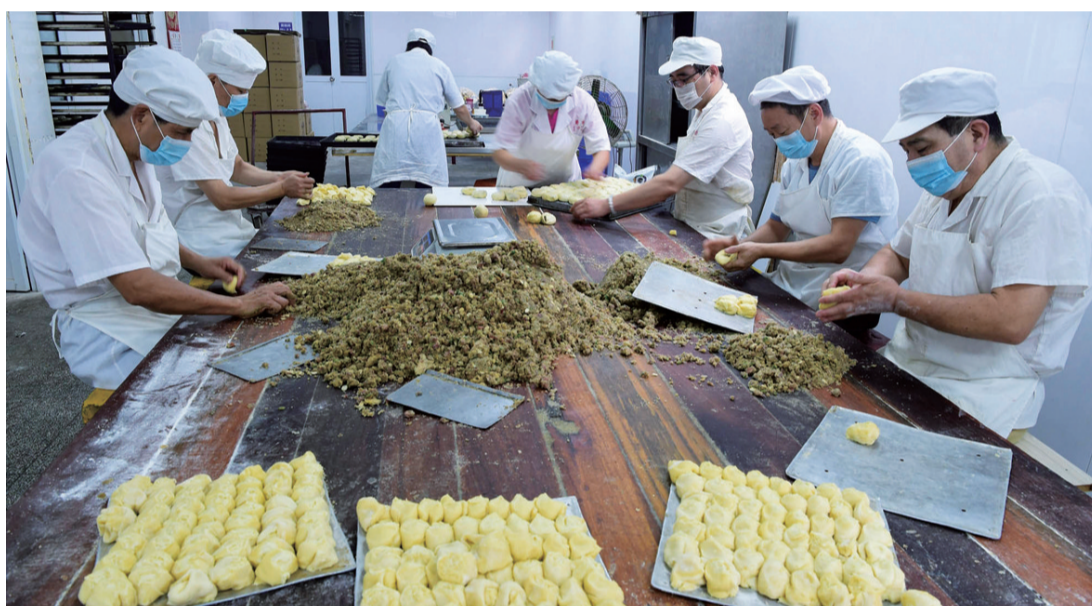
传统中秋佳节将至,镇江市爵禄食品有限公司(原镇江糕点厂)的工人们正在加紧赶制传统手工月饼。这两天,他们每天都要生产600公斤手工月饼,以满足市民对镇江“老味道”的需求。