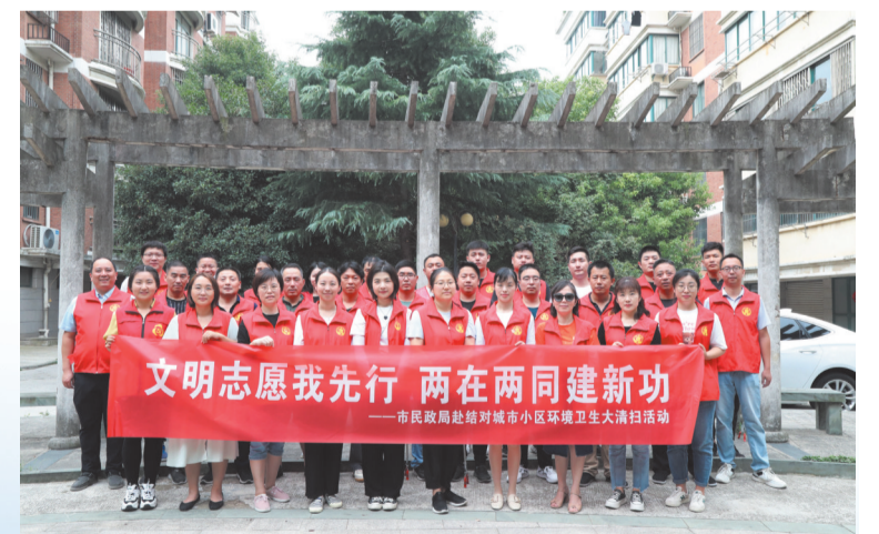
镇江市文明志愿者开展文明志愿服务先行两在两同建新功活动