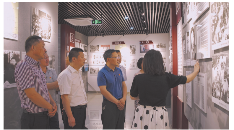
局领导班子成员赴新四军句容抗日斗争历史陈列馆接受党史学习教育

民营养老机构积极应对新冠肺炎疫情,对全市15家民营养老机构发放一次性纾困补贴112万元,切实保障民营养老机构运营。充分发挥慈善领域对困难群体的帮扶作用,协调慈善总会给予一次性的资金补助,疫情期间为1315户困难家庭发放慈善救助金共计100万元;另外,批准市红十字会在疫情期间进行公开募捐,共募集善款3.9716万元,募集慈善物资1.8362万件,折合现金14.0695万元,并交由市疫情防控指挥部统一调度使用。