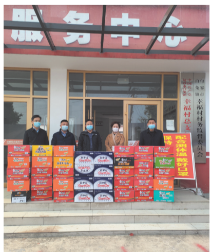
向白兔镇幸福村捐赠防疫生活物资