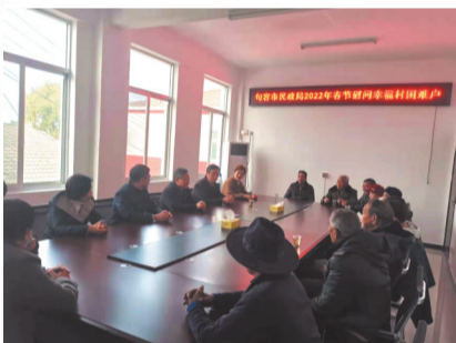
市民政局赴白兔镇幸福村走访慰问