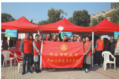
“民政先锋”党员志愿服务组织开展志愿服务活动的现场