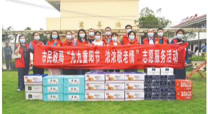
组织志愿者参加学雷锋志愿服务集市开集仪式