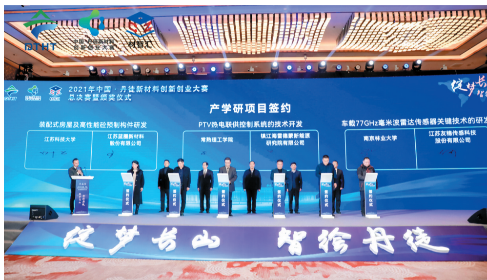
由丹徒科技镇长团参与承办的2021年中国·丹徒新材料创新创业大赛总决赛暨颁奖仪式在丹徒高新园举行。