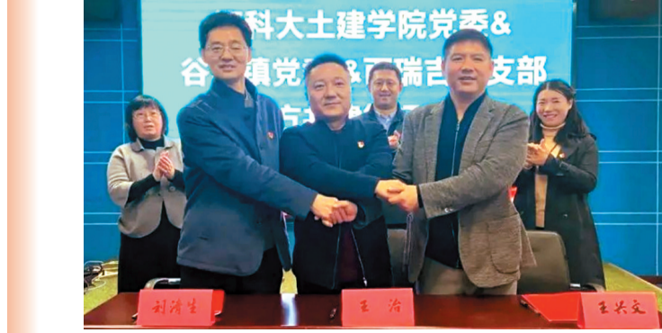
丹徒科技镇长团推动江苏科技大学土建学院党委、谷阳镇党委和江苏蓝圈新材党支部党建三方协议签约。