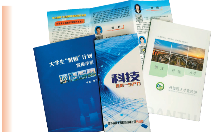
第十四批科技镇长团丹徒团印发的企业集体名片和相关政策宣传材料。