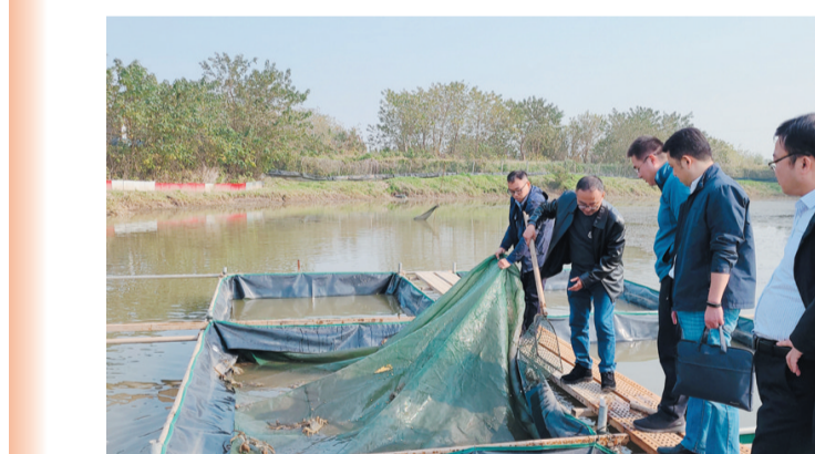
丹徒科技镇长团集体调研江心洲农业企业，图为水产养殖现场。