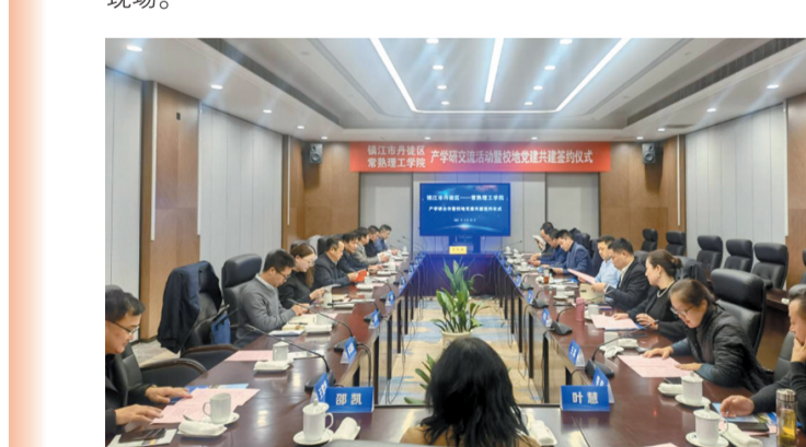
丹徒科技镇长团赴常熟理工学院开展产学研交流活动。