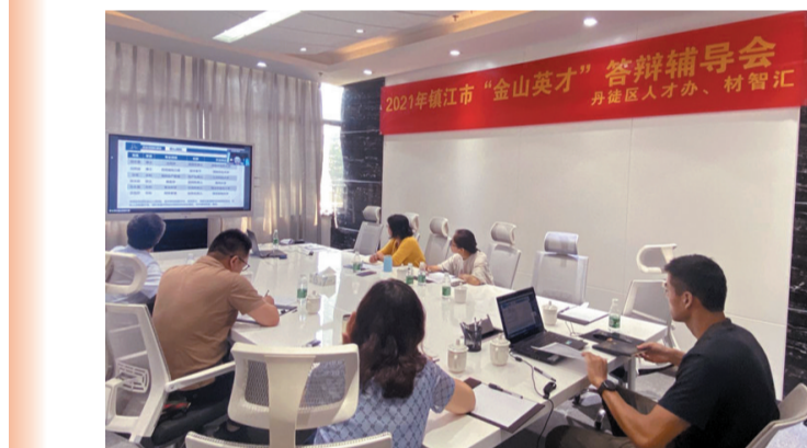
丹徒科技镇长团成员参加区2021年镇江市“金山英才”答辩辅导会，进行线上辅导。