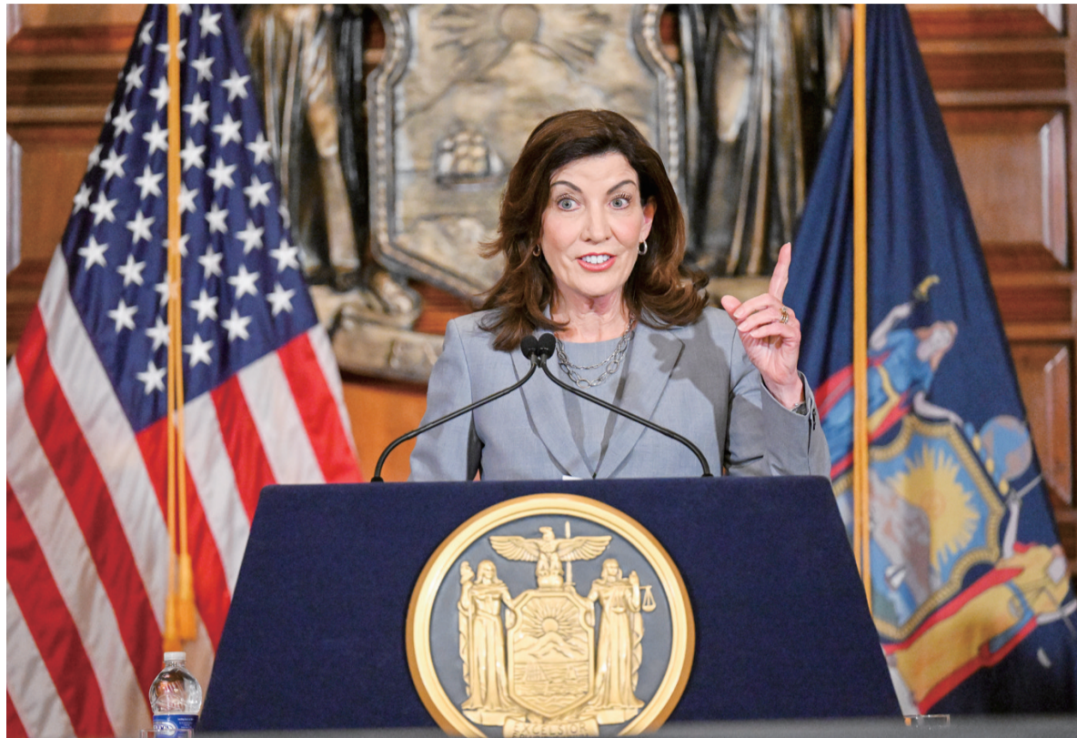
7月1日，美国纽约州州长凯茜·霍楚尔在奥尔巴尼接受记者采访。