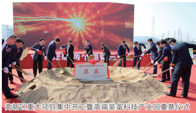
高新区重大项目集中开工暨高端装备科技园奠基仪式