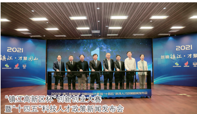
“镇江高新区杯”创新创业大赛暨“十四五”科技人才政策新闻发布会