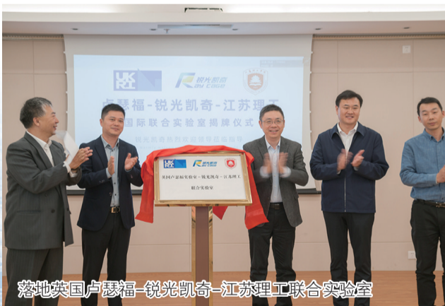
落地英国卢瑟福-锐光凯奇-江苏理工联合实验室