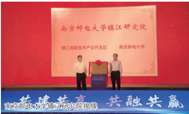
南京邮电大学镇江研究院揭牌