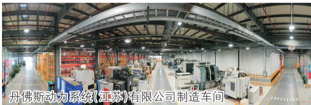
丹佛斯动力系统(江苏)有限公司制造车间

学术技术带头人、骨干、新秀等本土人才；认真组织落实本土人才“三带”计划，储备培养一批能够带动技艺传承、带动产业发展、带动群众致富的能工巧匠、经营能人、生产能手；对入选“十佳”农民、市级以上农村创新创业大赛获奖项目，根据获奖层级及奖励金额，给予1:1区级配套奖励；支持在镇高校高层次人才（团队）申报“团山英才”计划。