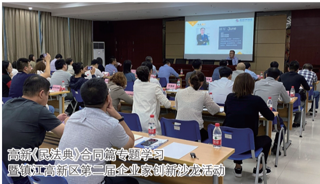
高新《民法典》合同篇专题学习暨镇江高新区第二届企业家创新沙龙活动