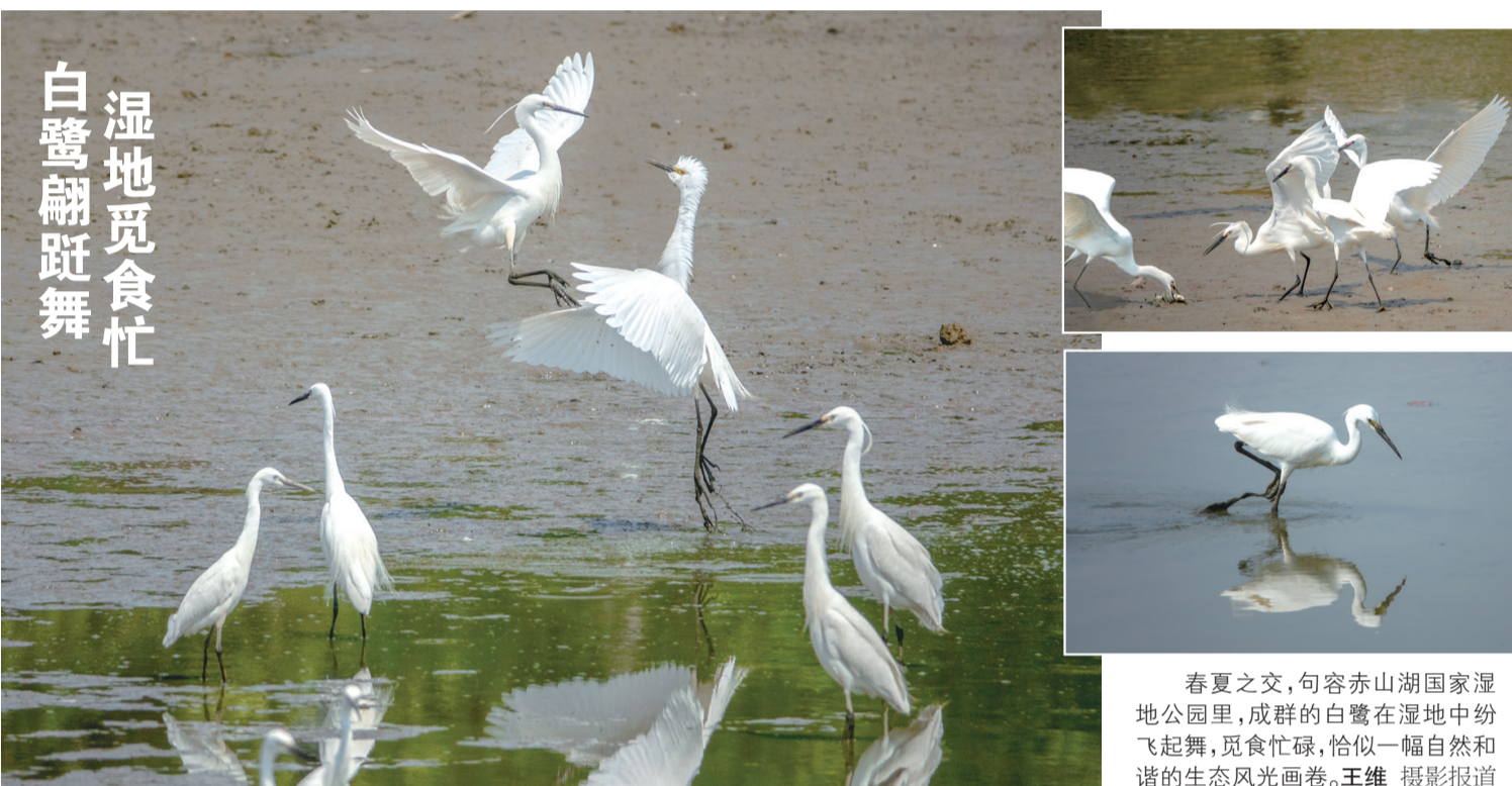
白鹭翩跹舞 湿地觅食忙

“我们现在住在南京，无法来现场办理、领取通行证，怎么办？”园区内以米陶科技为代表的多家企业的职工反映。了解到这一情况后，“红色帮办员”及时上报反馈，宝华镇党委书记开协调会议，研究制定方案，开辟线上办理绿色通道，企业职工可线上申请办理，领取电子通勤证，赢得了企业及职工的点赞。