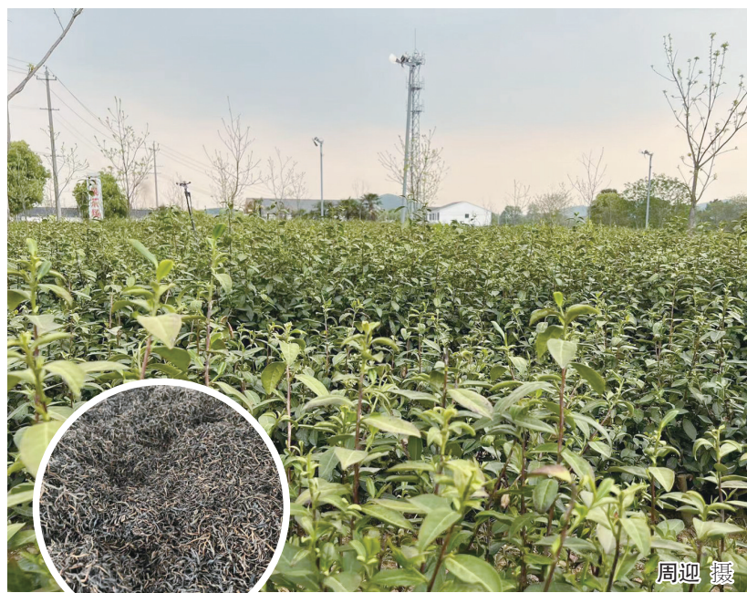
本报记者 周迎 本报通讯员 赵云

“今年茶叶价格基本维持去年同期水平，有些同行还略有上涨。”“今年的销售行情不是很好，高档茶销售有所下降。”清明已过，时间正一步步迈向谷雨，对于我市茶产业来说，今年产销路走得有些难。疫情防控的“大背景下”，如何稳产增收，成了所有茶企都必须面对的问题。