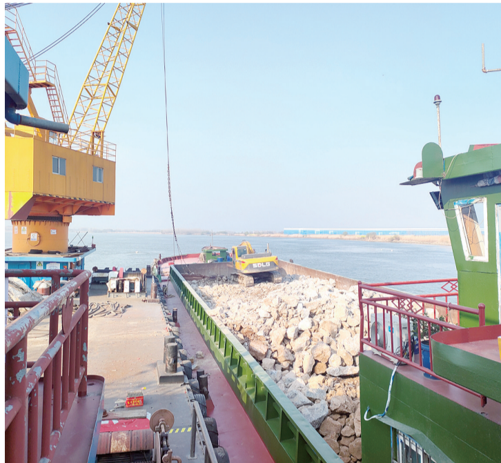
长江镇扬河段孟家港下段2021年度应急护岸工程

立专家工作组,为防汛工作提供有力支撑。当前,各级防办提早谋划部署汛前值班值守工作,强化部门间信息共享和工作协同,切实形成工作合力。同时,广泛开展防汛减灾宣传,提高公众自我防范意识和自救互救能力,筑牢防灾减灾救灾的人民防线,营造出防汛救灾工作良好氛围。