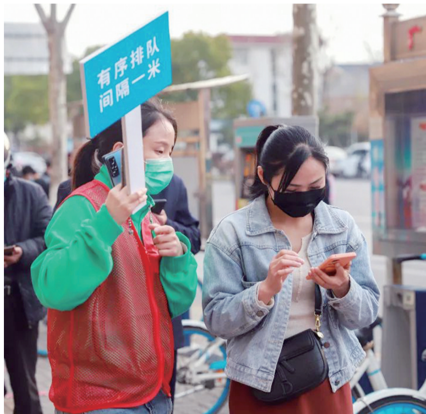
有序排队,保持安全距离。

据悉,疫情防控督查专班由36人组成,分别下沉到扬中6个镇街区,除做好疫情防控氛围营造、措施落实工作的督查外,专班成员还将根据需要,随时充实到各地疫情防控工作中去。