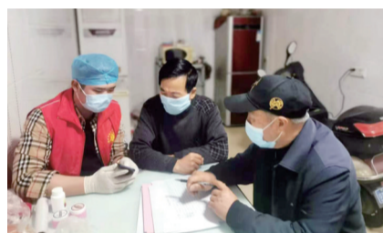
敲门行动,不留信息死角。

此外,扬中还通过“大数据+网格化”关注疫情重点地区返乡人员,按照网格化责任分工,由各村(社区)守土尽责加强外来务工人员、流动人口,尤其是外来重点人员和重点机构场所人员的排查和健康监测;“线上+线下”开展疫情防控宣传,全面扩大疫情防控宣传覆盖面,营造了全民紧绷疫情防控思想弦的社会氛围。