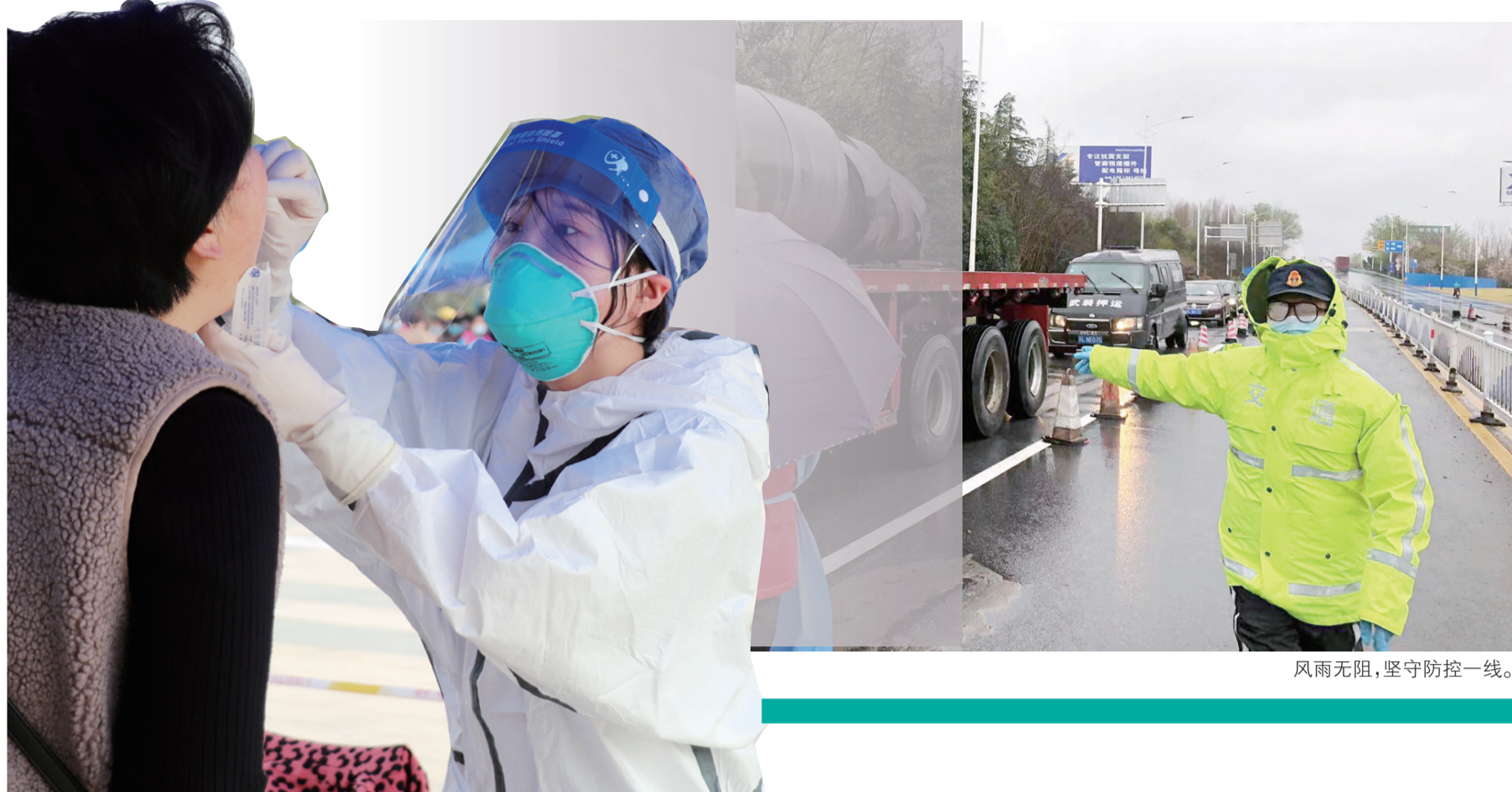
核酸检测,坚持应检尽检。