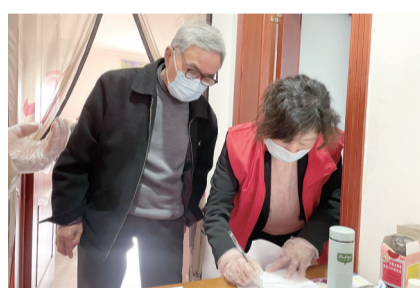
配合登记,主动提供信息。