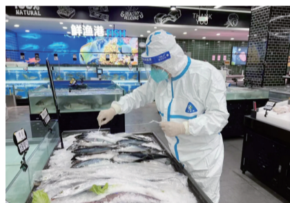
采集样本,确保食品安全。