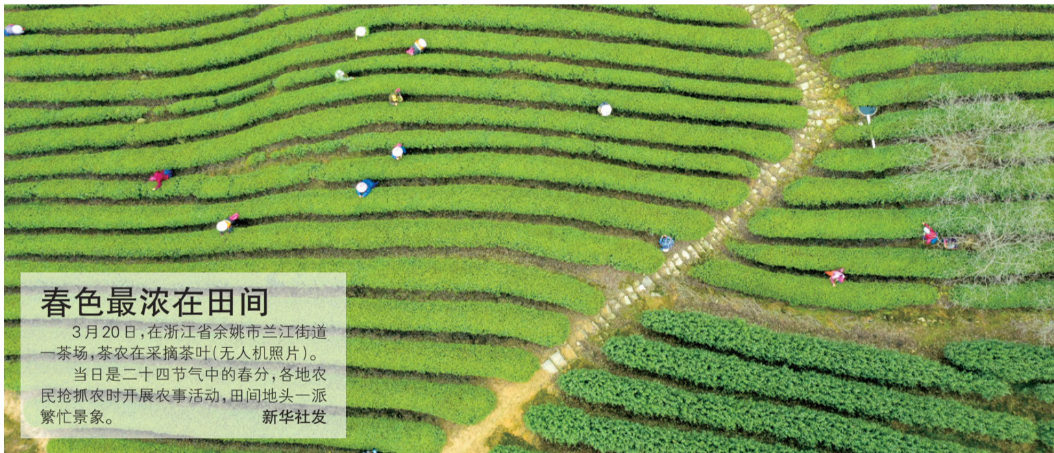
春色最浓在田间 3月20日，在浙江省余姚市兰江街道一茶场，茶农在采摘茶叶(无人机照片)。当日是二十四节气中的春分，各地农民抢抓农时开展农事活动，田间地头一派繁忙景象。

往沈阳南站，乘坐高铁返回阜新。经查，这名无症状感染者从疫情严重地区返回，在返回途中更换手机卡，意图隐瞒旅居史，未如实向社区报备行程。目前，当地公安机关已对其立案侦查。沈阳市公安局也公布了涉疫违法犯罪案例，其中，一人被确诊为新冠肺炎患者，在疫情防控工作人员流调过程中，故意隐瞒行程轨迹，致使多人被集中隔离，被公安机关依法立案侦查。另一位棋牌社经营者，违反沈阳市新冠肺炎疫情防控指挥部发布的疫情期间暂时停业规定，违规营业，造成人员聚集。目前，这名经营者已被公安机关依法予以行政拘留处罚。