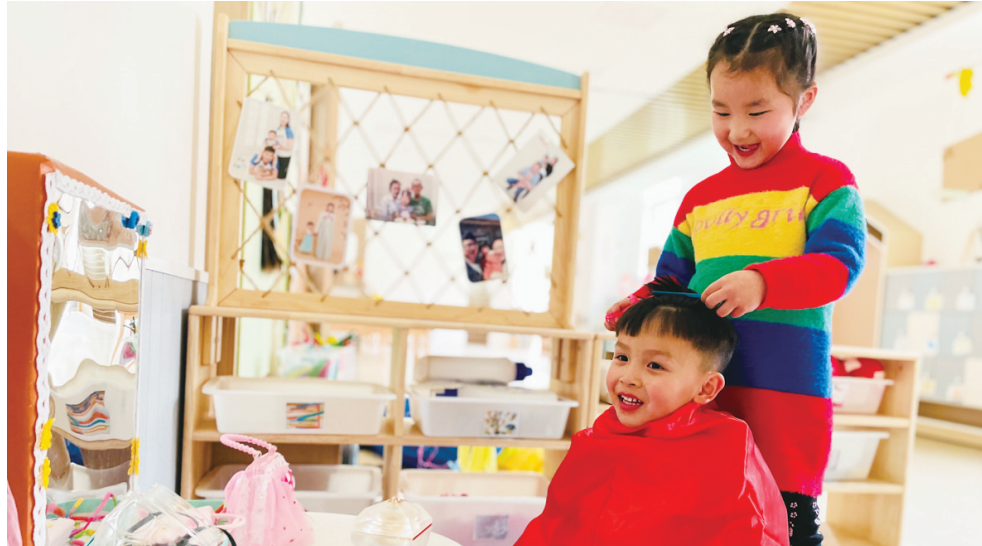
近日，市中山路中心幼儿园中分园的孩子们在丰富的活动中体验了“龙抬头”的趣味民俗。孩子们通过制作“龙”，感受民俗的乐趣；区域游戏中，孩子们扮演理发师，开心地为同伴理发，不亦乐乎。