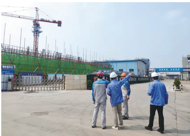
图为新区经发局工作人员走访企业上门服务。

在肩更应奋发作为。新的一年,新区经发局将坚持“实事求是、稳中求进”主基调,聚焦项目建设、营商环境优化、政银企共建等重点任务,以最优机制贯通项目推进全周期,以最暖生态优化营商环境全要素,以“最强支撑”夯实产业强区“全链条”,以奔跑的姿态、战斗的状态、赶考的心态,为全区经济高质量发展作出新的更大贡献。