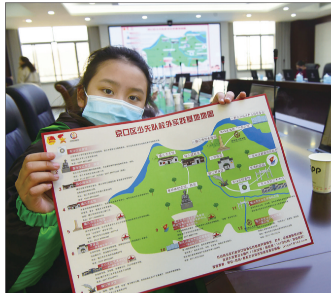
3月3日,京口区少先队校外实践基地地图发布活动举行。实践基地地图由镇江科技馆、镇江市烈士陵园、镇江市方志馆等12个实践基地组成,每个实践基地有一个手绘图并配有简短文字介绍,充分发挥了少先队组织教育、自主教育、实践教育的优势。

的同时,还会关心老人,问问老人的身体状况,陪他们聊聊天。同时还给老人开展了预防诈骗的宣传活动,给现场的老人讲解了如何捂紧自己的口袋,保住血汗钱,大家听的特别认真。 活动最后,官兵们还为老人测量了血压,教老人如何使用智能手机,老人们特别开心,学雷锋,做好事,让老百姓切切实实感受到了人民子弟兵的爱民情怀。