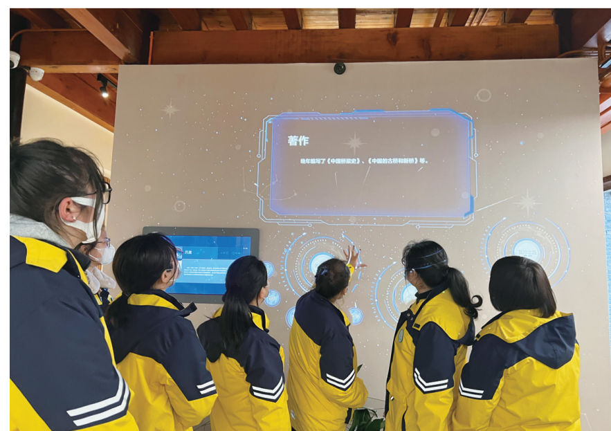
3月2日下午,丁卯社区及谷阳新村幼儿园党员教师前往镇江方志馆参观,重温了革命英雄雷锋的故事,传承与弘扬雷锋等革命先辈的精神。