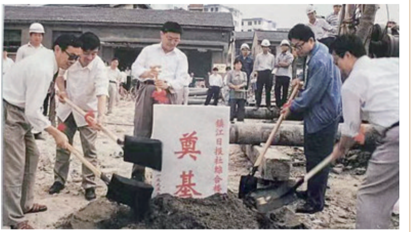
老总们为报社大楼奠基