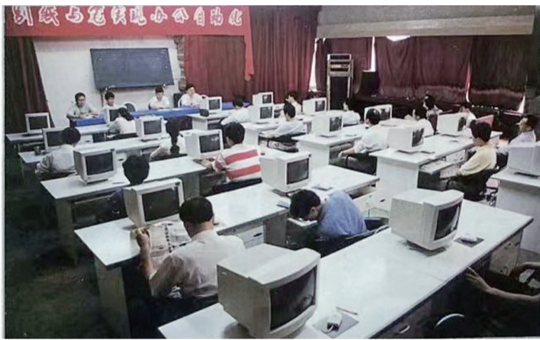
办公自动化岗前培训班开学,本报召开“告别纸与笔”动员大会

作为一名老报人,我衷心祝愿镇江报业集团越做越大,明天越来越好。祝愿《镇江日报》在宣传党的理论、路线、方针、政策上,发挥党委、政府和人民群众的桥梁作用,传递市委、市政府重大决策部署,忠实反映人民群众呼声,努力为实现第二个百年奋斗目标、实现中华民族伟大复兴的中国梦作出更大的贡献!(作者系镇江日报社原副社长,文题为编辑所拟)