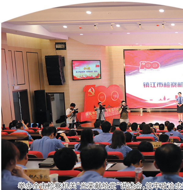
举办全市检察机关“光荣献给党”讲会,筑牢政治忠诚