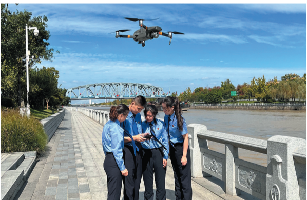
检察官利用无人机开展大运河“百里巡航”,促进大运河环境保护