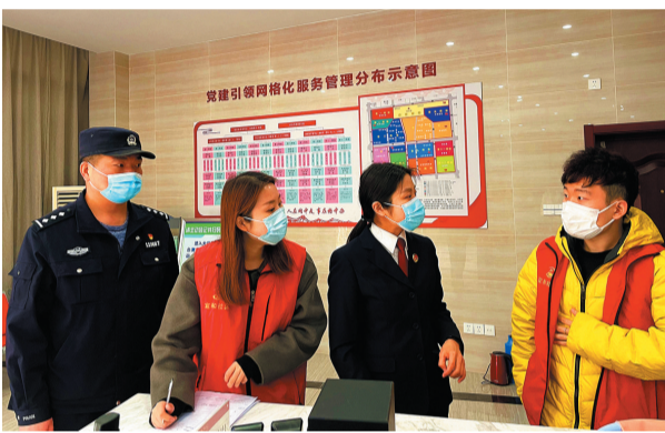
检察官进网格征求意见建议

“过去五年,是全市上下向着“三高一争”激情奔跑的五年,也是镇江检察经历重塑改革、加速转型发展的五年。五年来,全市检察机关全面贯彻习近平法治思想,深入践行“讲政治、顾大局、谋发展、重自强”的总要求,协调推进“四大检察”“十大业务”均衡发展,共办理刑事、民事、行政、公益诉讼等各类案件59602件,96件案件入选全国、全省典型案例,233个集体和个人荣获省级以上表彰。”