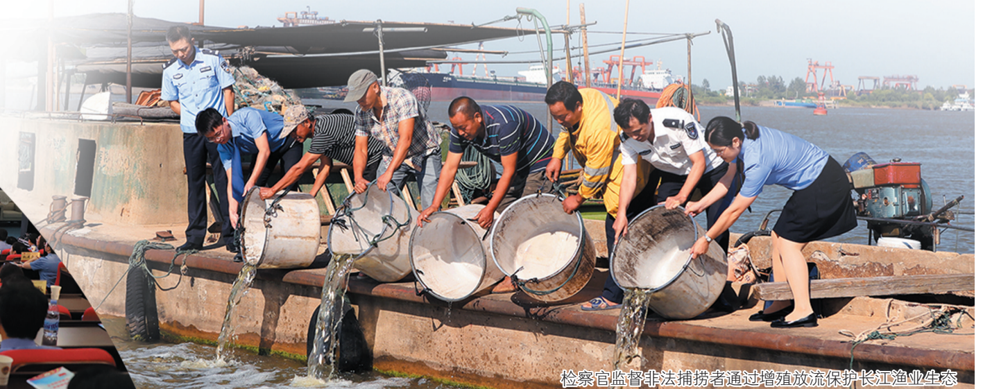
检察官监督非法捕捞者通过增殖放流保护长江渔业生态

市第八次党代会吹响了向着现代化新镇江激情奔跑的集结号。2022年,全市检察机关将锚定“三高一争”,坚持“稳中求进、勇争一流”总基调,踔厉奋发、笃行不怠,全面履行法律监督职能,努力以高质量履职服务经济社会高质量发展,在检察一域争光,为全市大局添彩,以实际行动迎接党的二十大胜利召开!