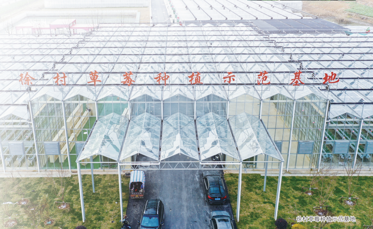
徐村草莓种植示范基地