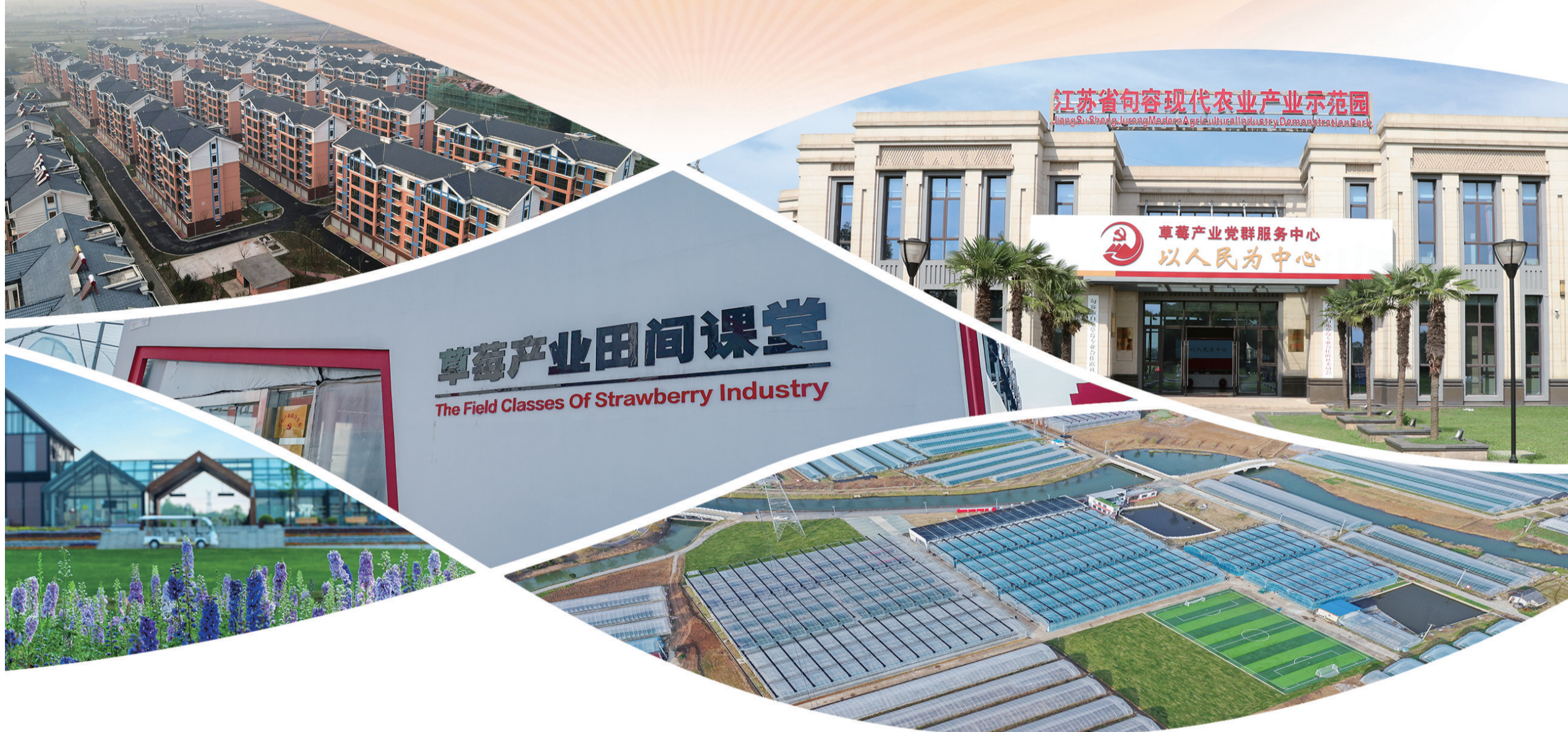
草莓产业田间课堂 The Field Classes Of Strawberry Industry