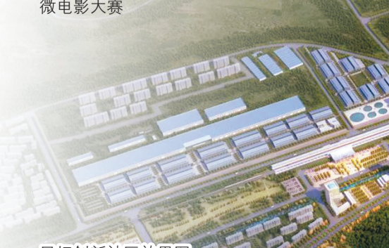
凤坛创新社区效果图