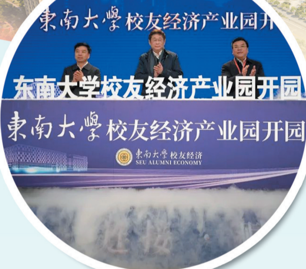
东南大学校友经济产业园开园