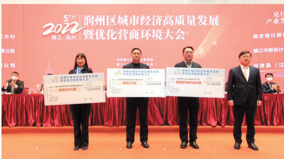
润州城市经济高质量发展暨优化营商环境大会

牛年有牛绩，虎年扬虎威。2022年是党的二十大召开的喜庆之年，也是润州加快构建“双轮驱动”新格局，纵深打造现代城市经济体系的关键一年。站在现代化建设的新起点上，润州将坚决践行“争当表率、争做示范、走在前列”光荣使命，聚精会神引项目、盯项目、推项目，把项目建设作为全年经济工作的第一要务，以“全链条”思维破解“痛难堵”问题，全面掀起大抓项目、大干项目的虎虎生威势，为现代化一流主城区建设赋能增势、增光添彩。