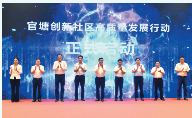
“官塘创新社区高质量发展行动”启动仪式

刚刚过去的2021年，是承压奋进、乘势而上、开新图强的一年，也是大事频频、喜事连连、收获满满的一年。一年来，润州坚持以习近平新时代中国特色社会主义思想为指导，认真贯彻落实中央、省、市各项决策部署，在感悟党史中增强信心决心，在接续奋斗中绘好“一张蓝图”，城市经济发展开启生产性服务业和数字经济“双轮驱动”的崭新篇章，全区上下人心向上、人心思进，意气风发地迈上了建设现代化一流主城区的时代征程。