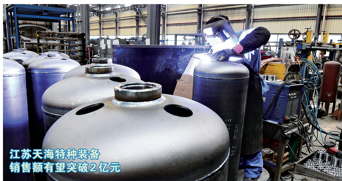
江苏天海特种装备 销售额有望突破2亿元

性、战略性新兴产业的谋篇布局。用“养老母鸡”理念招引企业，就是要精心谋划，在促进产业集群发展上突出“聚”，通过上下游关联、延链补链强链抓项目，努力实现“母鸡带小鸡、小鸡聚成群”的产业链条式集群式推进。要深度分析“四群八链”重点产业的产业基础和比较优势，理清产业发展脉络和路径，科学规划产业发展战略。项目招引、布局、建设等各个环节都要向四个产业集群、八条产业链聚焦，搞清楚有什么、缺什么、怎么办，形成梯度推进态势，推动产业项目向高端进军、产业链条向上下游延伸、产业基地向高地迈进。