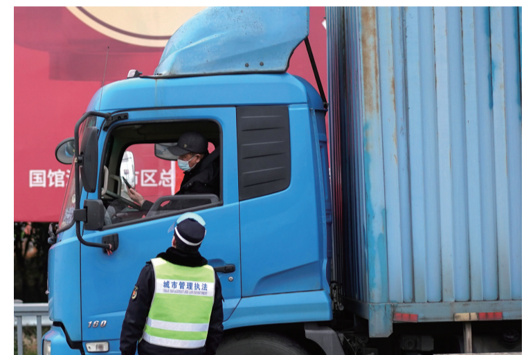
苏州设置31个高速公路离城检查点。图为执法人员在京沪高速公路苏州新区收费站查验。