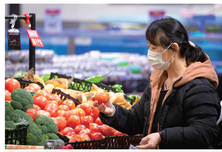
2月16日,顾客在南京一家超市选购蔬菜。

郭丽岩分析,我国经济持续恢复发展,工农业产品和服务供给充裕,粮油肉蛋奶果蔬等重要民生商品供应充足,煤炭、油气等基础能源保障有力,有效应对市场价格异常波动的能力显著增强,保持2022年物价平稳运行仍具有较好支撑。