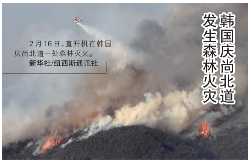
韩国庆尚北道发生森林火灾

这张2月16日航拍的照片显示，巴西彼得罗波利斯一些房屋遭山体滑坡侵袭。 巴西里约热内卢州消防部门16日通报说，位于该州内陆山区的彼得罗波利斯市15日下午骤降暴雨，一些道路被暴涨的河水淹没，并发生多起山体滑坡事故，目前灾害已造成至少34人死亡。