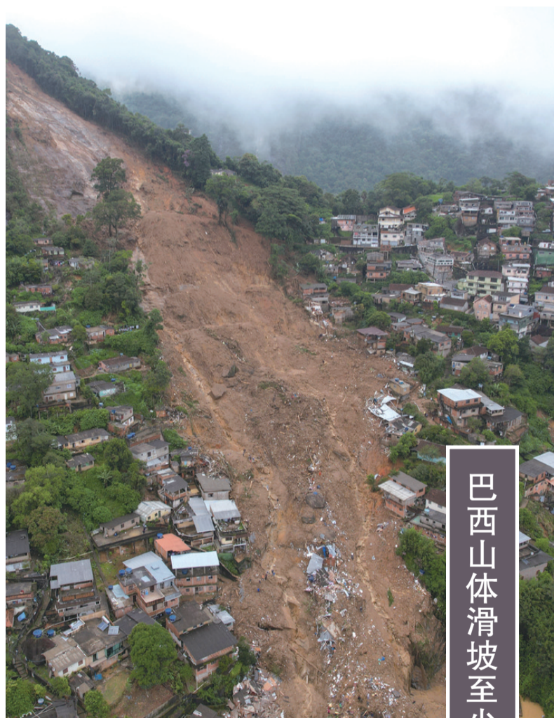
巴西山体滑坡至少34人死亡

供暖系统工程师，不久前刚生下第二个孩子。她说，最令她心烦的莫过于西方一些国家媒体铺天盖地关于战争的各种夸张报道和虚假信息。对于普通百姓而言，过去几年，大家一直生活在东部地区冲突的恐怖阴影下，已经对战争感到“疲惫”。 她说，人类应该学会和平相处，停止战争就是停止伤害，希望紧张局势早日结束，期待东部地区边境早日开放。 近期，俄乌双方在两国边境地区部署了大量军事人员和装备，美国和北约称俄罗斯有“入侵”乌克兰之势。俄方予以否认，强调北约活动威胁边境安全，俄方有权在境内调动部队保卫领土。俄总统新闻秘书佩斯科夫15日宣布，部分俄军已经结束演习，开始从俄乌边境返回基地。