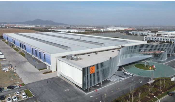
万事达高性能围护系统智能制造基地项目。

打好防范金融风险攻坚战,争当守底线标兵。推动“政银企共建+”深度合作,与金融机构开展深层次、全方位战略合作,形成政银企良性互动局面;全面开展融资“削峰计划”,增强金融风险防范能力;落实“扬帆计划”,加强上市企业梯队建设,为拟上市企