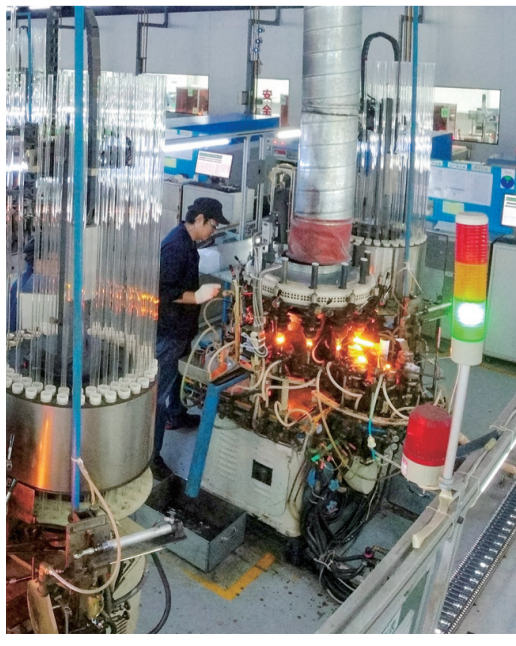
《火红的岁月》 朱武江