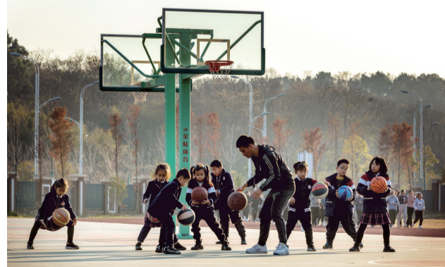
《冠军的摇篮》 董根年