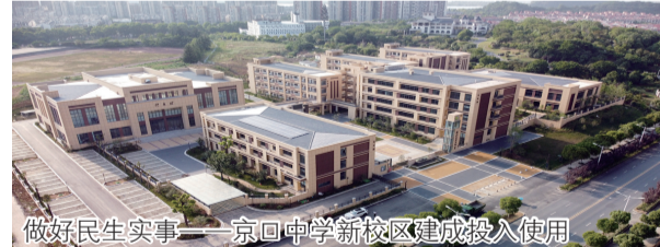
做好民生实事——京口中学新校区建成投入使用