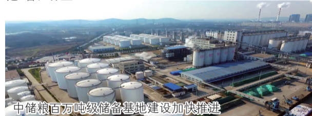
中储粮万吨级储备基地建设加快推进