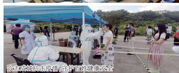
众志成城抗击疫情,守护百姓健康安全