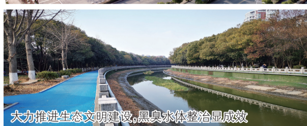
大力推进生态文明建设,黑臭水体整治显成效