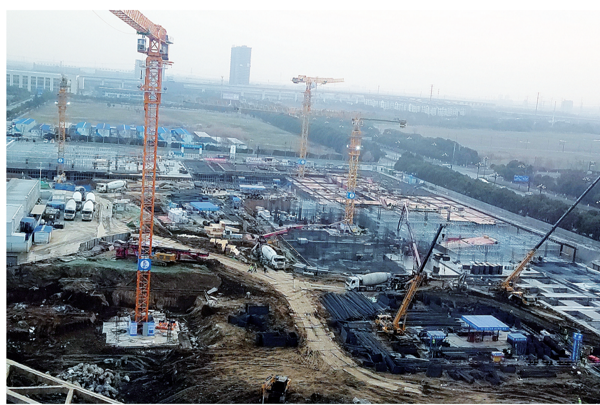
镇江好未来现代教育基地施工现场。

2020年，大学园用新区1/11的土地，产出1/8的销售、1/7的外资、1/5的公共预算收入，70%的各类创新人