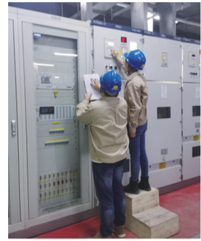
图为并网发电后工作人员读取发电度数。港能电力供图