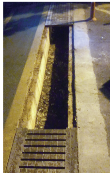
排水沟盖板被盗现场。

《意见》明确,盗窃、破坏正在使用中的社会机动车通行道路上的窨井盖,足以使汽车、电车发生倾覆、毁坏危险,尚未造成严重后果的,以破坏交通设施罪定罪处罚;盗窃、破坏人员密集往来的非机动车道、人行道以及车站、码头、公园、广场、学校、商业中心、厂区、社区、院落等生产生活、人员聚集场所的窨井盖,足以危害公共安全,尚未造成严重后果的,以危险方法危害公共安全罪定罪处罚。对于盗窃、破坏以上两种情形以外其他场所的窨井盖的行为,明知会造成人员伤亡后果而实施盗窃、破坏行为,致人受伤或死亡的,依法以故意伤害罪、故意杀人罪定罪处罚。