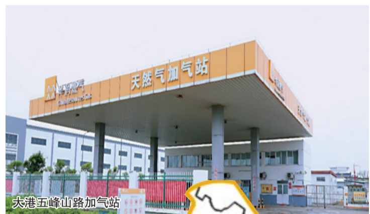
大港五峰山路加气站