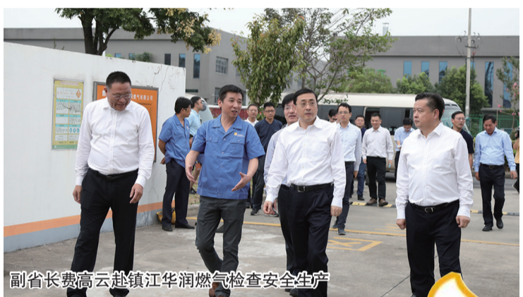
副省长费高云赴镇江华润燃气检查安全生产

当前，镇江正发力“跑起来”，奋力冲刺高水平全面小康建设，努力把习近平总书记的殷切寄语“镇江很有前途”变成可触可感的生动现实。华润燃气将继续秉承“专业、高效、亲切”的服务宗旨，践行红色央企的初心与使命，履行责任义务，坚定创新转型、高质量发展的步伐，铆足干劲、奋力奔跑，以更加优质的服务回馈用户，为“强富美高”新镇江建设作出更大贡献！