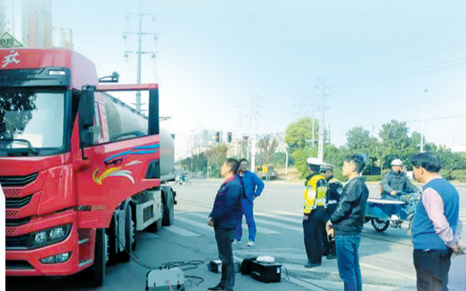
运输车辆尾气检测