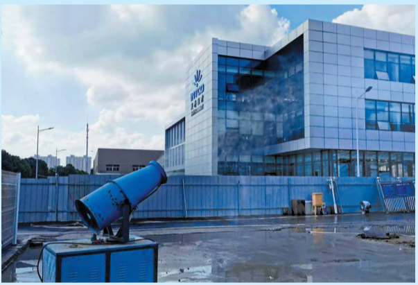
工地扬尘管控——雾炮开启