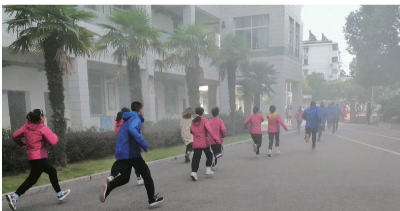
镇江实验学校火灾紧急疏散演练。

镇江实验学校副校长祝锋表示,这次演练旨在让学生学习安全知识,提高安全防范意识,增强自救自护自护能力,掌握在危急情况下的逃生本领,希望他们积极向家长、朋友和邻居宣传,让更多的人关注安全,珍爱生命。