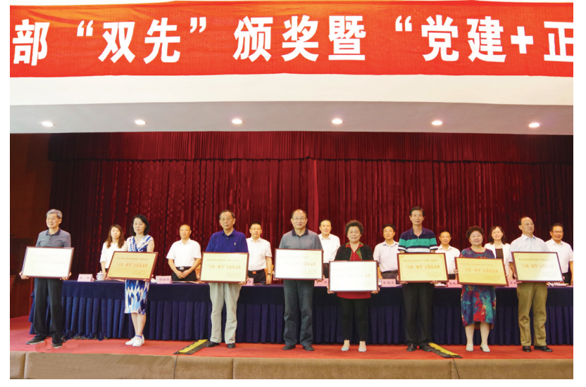
9月7日，第二批市级示范党支部集中授牌现场。

全市各条战线上的老同志、老同志们正通过积极参与志愿服务活动，将一支支小爱的溪流汇聚成大爱的海洋，做好党的政策宣传员，社会治理的智囊团和经济社会各项建设的建言者、参与者，为打造更美好的镇江贡献着余热。