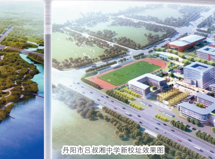
丹阳市吕叔相中学新校区效果图