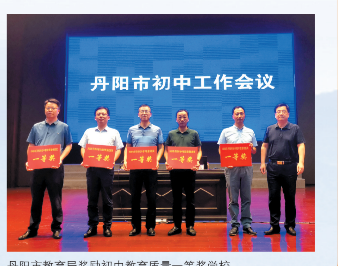
丹阳市教育局奖励初中教育质量一等奖学校