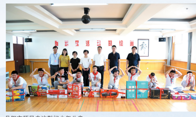
丹阳市领导走访慰问少年儿童