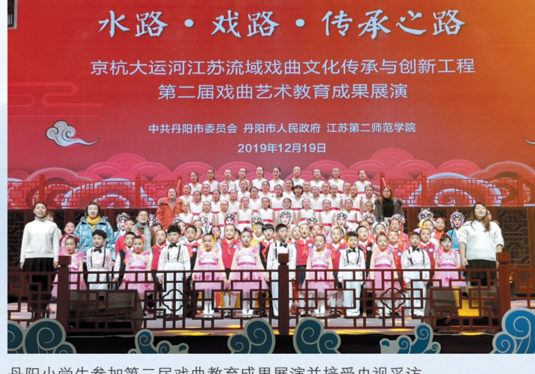
丹阳小学生参加第二届戏曲教育成果展演并接受央视采访