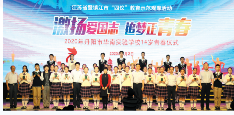
丹阳承办江苏省暨镇江市“四仪”教育示范观摩活动——14岁青春仪式专场