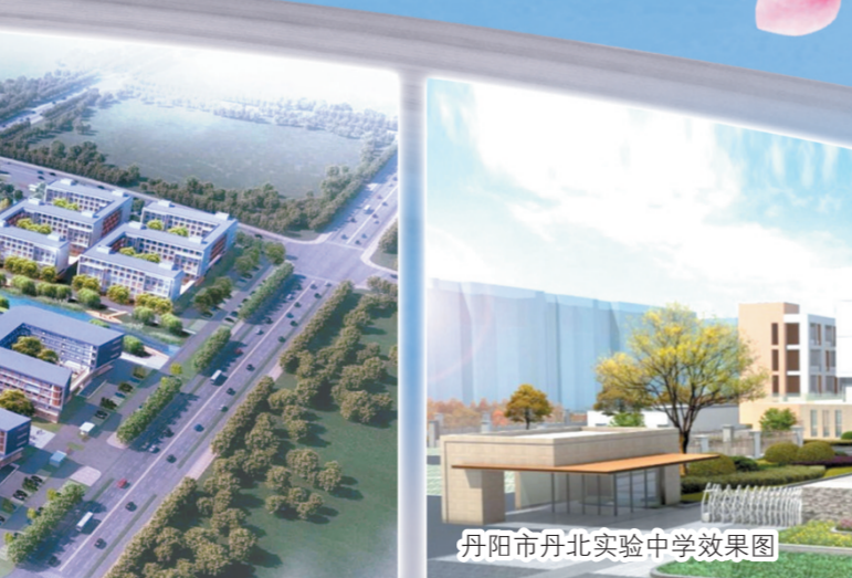
丹阳市丹北实验中学效果图