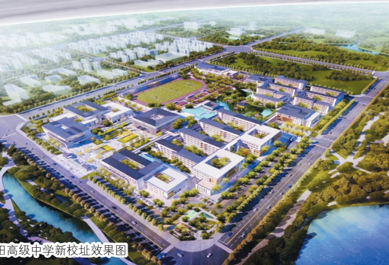
江苏丹阳高级中学新校区效果图