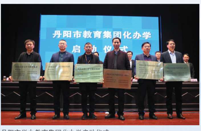
丹阳市举办教育集团化办学启动仪式