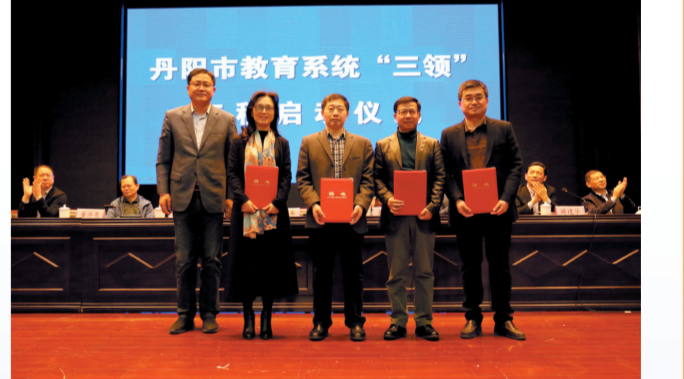
启动丹阳市教育系统“三领”工程